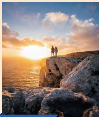
ディングリ・クリフ

マルタ島中央部、地中海を望む丘の上にある巨石神殿群。中には高さ20mもある巨石で神殿が形作られている部分もある。春分と秋分の日だけに陽射しが入る穴が穿たれた石もあり、高い天体知識を持った古代の人々が、多大なエネルギーを注いで完成させた神殿であることがしのばれる。