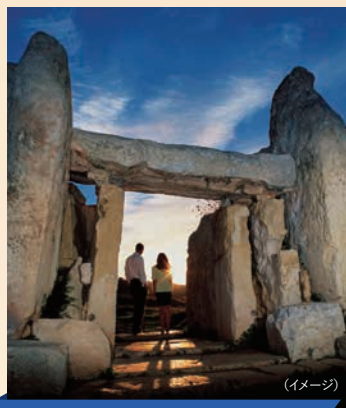
ハジャーイム&イムナイドラ神殿

19世紀にはこの教会に礼拝で訪れた村人が聖母の声を聴き、その後、村の人々の病気が治ったという伝説があり「奇跡の教会」とされる。ゴゾ島北西部の平原にボツンと建つ教会だが、教皇ヨハネ・パウロ2世がミサを行ったことも知られる。そのロケーションと伝説から、いかにも神聖なエネルギーを秘めた場所と感じられる。